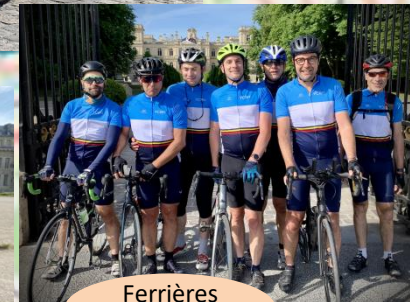
Ferrières en Brie