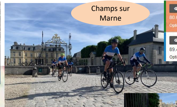
Champs sur Marne